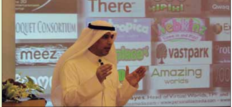
رئيس الجمعية يلقي محاضراته

شارك سعادة الدكتور سلطان بن محيا الديحاني رئيس جمعية المكتبات المتخصصة ( فرع الخليج العربي ) بورقة عمل في «الملتقى العلمي لمكافحة جرائم المعلوماتية» والذي نظّمته هيئة التحقيق والإدعاء العام بالمملكة العربية السعودية بالتعاون مع جامعة نايف العربية للعلوم الأمنية والذي نظم خلال الفترة من ٢٣ - ٢٥ شوال ١٤٢٠هـ، الموافق من ١٢ - ١٤ أكتوبر ٢٠٠٩م بمدينة الرياض بدعم من النائب الثاني لرئيس مجلس الوزراء ووزير الداخلية صاحب السمو الملكي الأمير نايف بن عبدالعزيز وبمشاركة ممثلي الجهات العدلية والقضائية بدول مجلس التعاون الخليجي، واستعرض الملتقى خلال تسع جلسات استمرت لمدة ٣ أيام شارك فيها مسؤولون وخبراء وباحثون من داخل المملكة وأمريكا وأوروبا والعالم العربي واستعرضوا فيها أربعة محاور رئيسية: خصائص الجرائم المعلوماتية وأنواعها وصفات مرتكبيها وكيفية التحقق من وقوعها، كما تم عرض تطبيقات ونماذج من الجرائم المعلوماتية عربياً وعالمياً، مع التركيز على طبيعة الجرائم المعلوماتية بدول مجلس التعاون الخليجي.