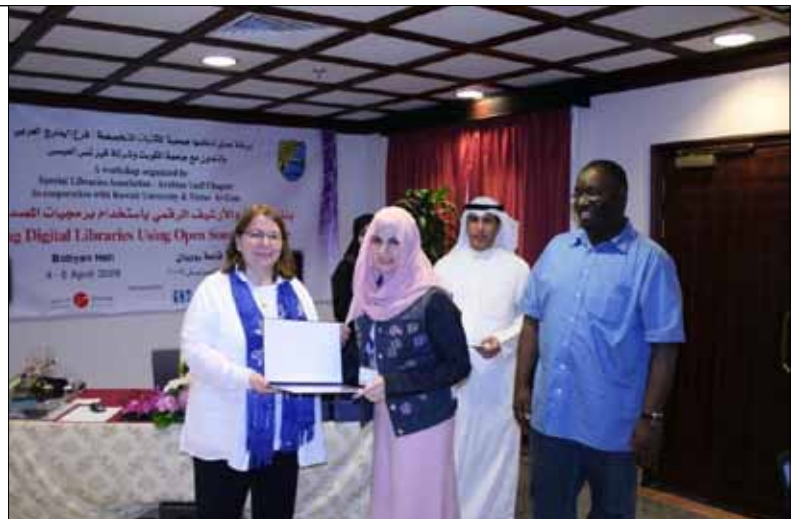
From Digital Library Workshop

Our programs for both of the workshops started in full force in a practical based environment. The programs were well-attended and the discussions were lively. Forty-four participants in each workshop including librarians, technical services directors, system librarians, and other information technology professionals from Oman, UAE, Saudi Arabia, Jordan, Bahrain, Kuwait, Syria, Lebanon and Qatar participated and had a group discussion and exchanged their experiences with regard to progress in learning. The workshops' theme was the promotion and integration of information and specifically to outline the current