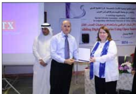
From Digital Library Workshop

Acknowledgement and appreciation are extended to TechKnowledge LLC, Science (AAAS), Integrated Information Network (IIN) and Virtus Publishing Group for their sponsorship and support.